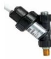
Narrow Web Inline "Y" Filter