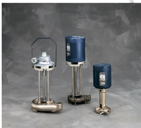
Pompes centrifuges pneumatique et électriques

Réservoir, pompe centrifuge pneumatique et filtres à encres