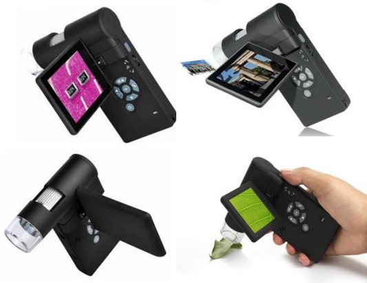
ASTRAMIC 500 MICROSCOPE NUMERIQUE PORTABLE