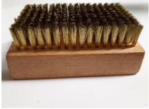
BROSSE LAITON POUR ANILOX CERAMIQUE ET ACIER