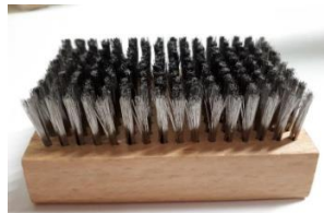
BROSSE INOX POUR ANILOX CERAMIQUE